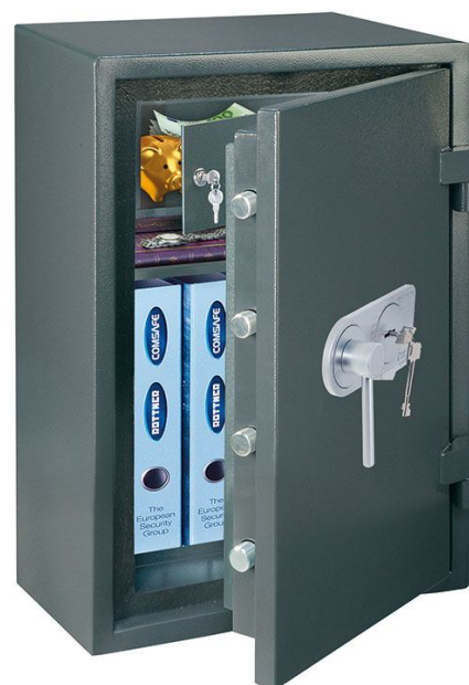
ATLAS EN1 închidere cu cheie